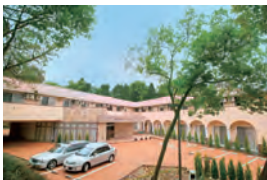
西宮市 介護付き有料老人ホーム エクセレント西宮