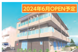
西宮市 高齢者グループホーム エクセレント夙川東