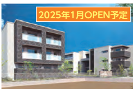
西宮市 高齢者入居可能賃貸住宅 エクセレント 神戸垂水プレミア