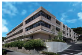
宝塚市 介護付き有料老人ホーム エクセレント 花屋敷ガーデンヒルズ