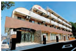
神戸市 介護付き有料老人ホーム エクセレント神戸