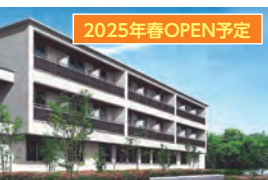
宝塚市 高齢者グループホーム エクセレント宝塚