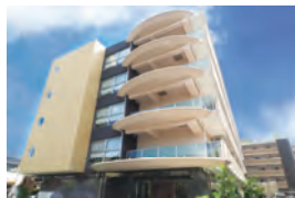
宝塚市 介護付き有料老人ホーム エクセレント 宝塚ガーデンヒルズ